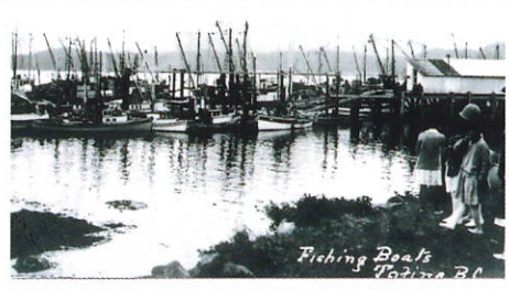
▲トフィーノに集まるトロリング(一本釣)漁船(1925年頃) Trolling fishing boats moored at Tofino (c.1925).