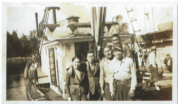
▲ユークレット漁者組合の職員離任式(1930年頃) Farewell Gathering at the Ucluelet Fishermen's Union (c.1930).