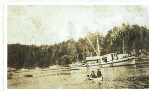
▲スプリング・コーブに浮かぶトロリング(一本釣)漁船(1925年頃) Trolling fishing boat in Spring Cove (c.1925).