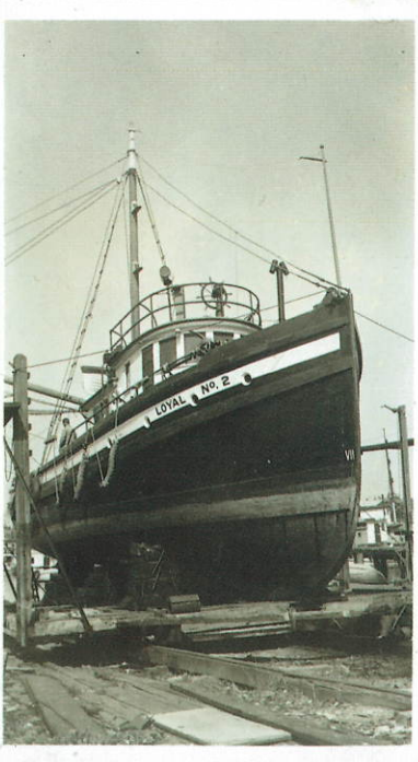
▲サケ運搬船のローヤル2号(1928年頃) The 'Loyal No.2' salmon carrier (c.1928).

河原典史(かわはらのりふみ) 1963年大阪府生まれ。立命館大学大学院文学研究科博士後期課程地理学専攻単位取得退学。立命館大学文学部教授。専門は歴史地理学・近代漁業移民史。著書に、「日系人の経験と国際移動——在外日本人・移民の近現代史」(米山裕との共編、人文書院、2007年)、「ビクトリアの球戯とバンクーバーの達磨落とし——20世紀初頭のカナダにおける日本庭園の模索」(マイグレーション研究会編『エスニシティを問いなおす——理論と変容』関西学院大学出版会、2012年)、「20世紀初頭のカナダ西岸における捕鯨業と日本人移民」(『地域漁業研究』52巻2号、2012年)、『『東宮殿下渡欧記念帖—金田之栄—』に写る玉名の子供たち——第二次大戦前におけるカナダ移民の一断面』(『歴史玉名』60号、2012年)などがある。