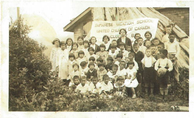
▲ユークレット日本語学校のサマーキャンプ②(1940年頃) Summer camp of the Ucluelet Japanese School (c.1940).