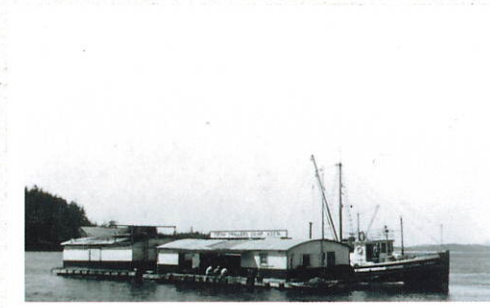
▲トフィーノ漁者組合②(1925年頃) Tofino Fishermen's Union (c.1925).