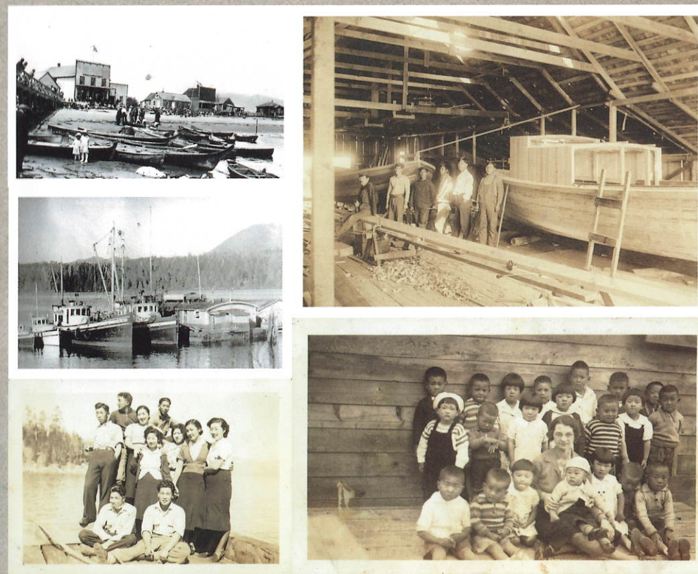
左上：トフィーノ沖のクレヨコット島の様子(1920年頃)