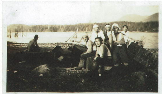
▲燃料用の薪収集に携わる人々(1930年頃) Workers gathering firewood (c.1930).